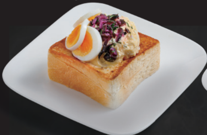
「くちどけもちこ」トースト たまごサラダ&しば漬け ¥540