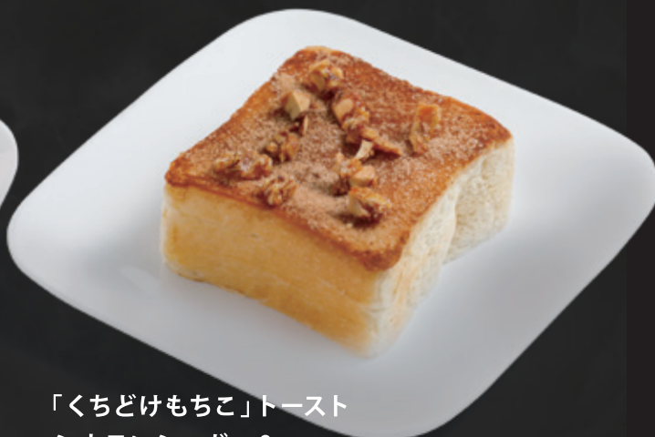
「くちどけもちこ」トースト シナモンシュガー& アーモンドキャラメリゼ ¥430

※価格は全て税込価格表示です。店内飲食とテイクアウトでは消費税率が異なります。 ※写真はイメージです。盛り付けや食器が実際と異なる場合がございます。