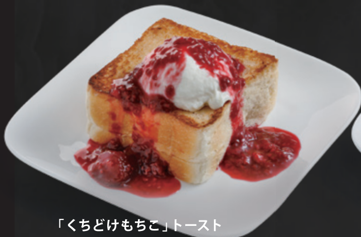
「くちどけもちこ」トースト ベリーコンフィチュール& マスカルポーネホイップ ¥540