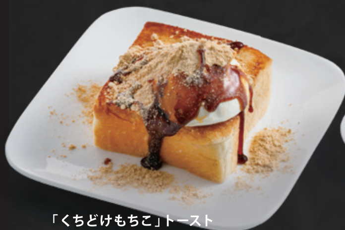
「くちどけもちこ」トースト 黒蜜きなこ& マスカルポーネホイップ ¥460