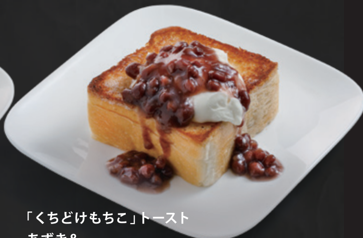
「くちどけもちこ」トースト あずき& マスカルポーネホイップ ¥460