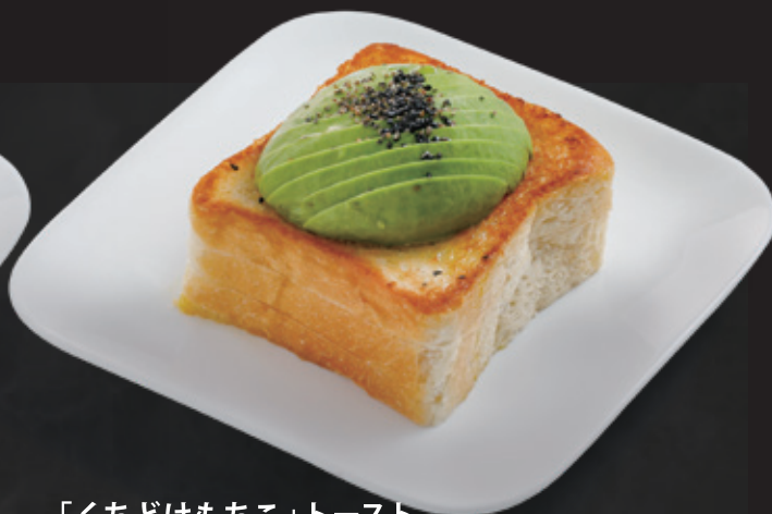
「くちどけもちこ」トースト アボカド&黒ゴマ ¥540