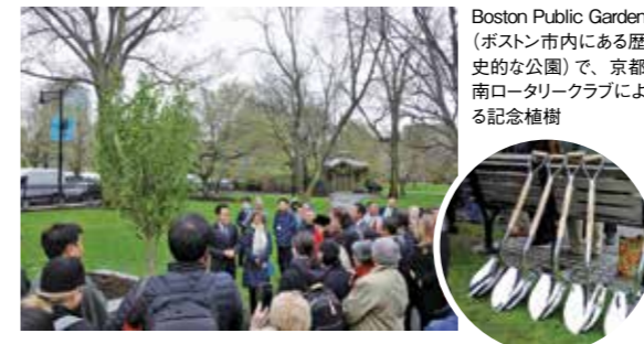
Boston Public Garden (ボストン市内にある歴史的な公園)で、京都南ロータリークラブによる記念植樹