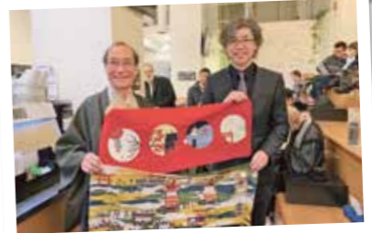
調印式の様子。調印式ではOGAWA COFFEE Bostonスタッフがコーヒーを提供